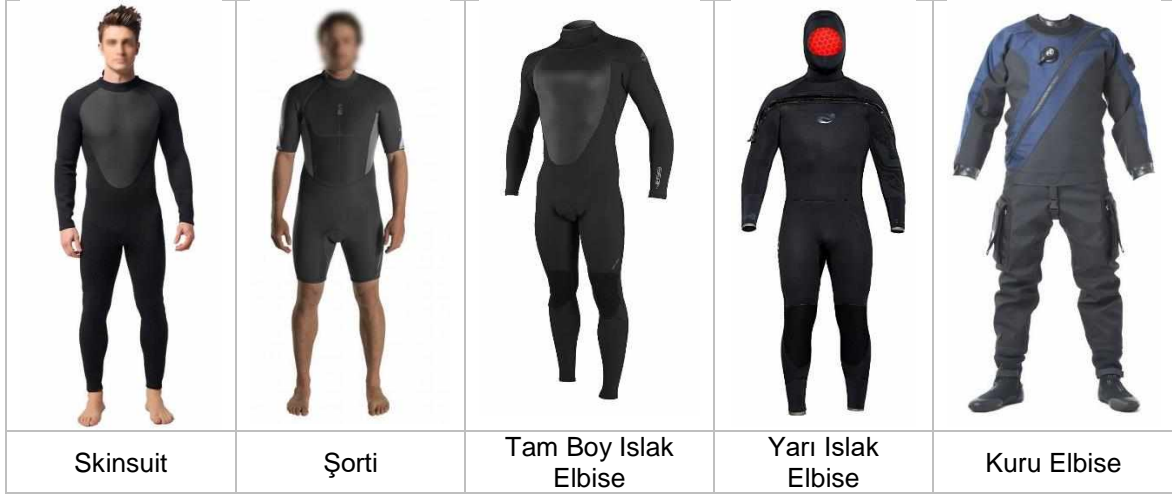
Şekil 2 – Dalış Elbisesi Türleri

BCD (Denge Yeleği - Buoyancy Control Device): Su yüzeyinde batmamanızı, su altında da dengede durmanızı sağlayan şişirilebilir yelektir. Ayrıca dalış için gerekli diğer ekipmanlar da bu yeleğe tutturularak taşınır.