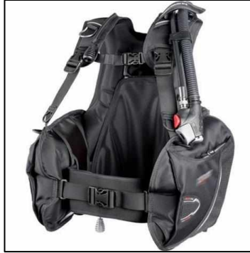
Şekil 3 - Denge Yeleği

Regülatör: Su altında değişen ortam basıncına göre dalgıcın hava almasını sağlayan ve tercihen yedek bir hava kaynağı (ahtapot) da içeren aygıttır.